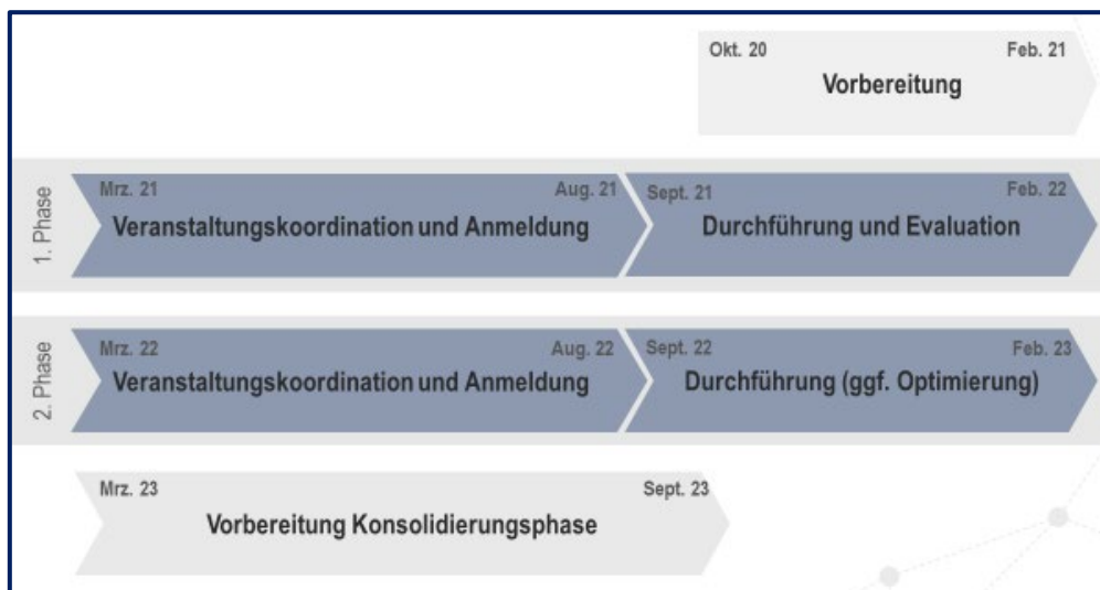
Abb. 2: Projektplan

Das Projekt richtet sich an junge Frauen mit Abitur, die nach der Schule innerhalb des 6-monatigen Programms ausprobieren können, ob MINT tatsächlich ihren Fähigkeiten und Vorlieben entspricht. Es findet eine, auf ein Studium vorbereitende Vermittlung von wissenschaftlichem und praxisorientiertem Wissen in den Bereichen Mathematik, Informatik, Naturwissenschaften oder Technik statt.